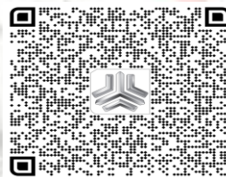
بارکد خودروی نیشان دوگانه سوز SVD