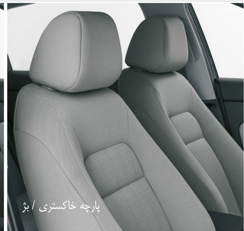
پارچه خاکستری / بژ