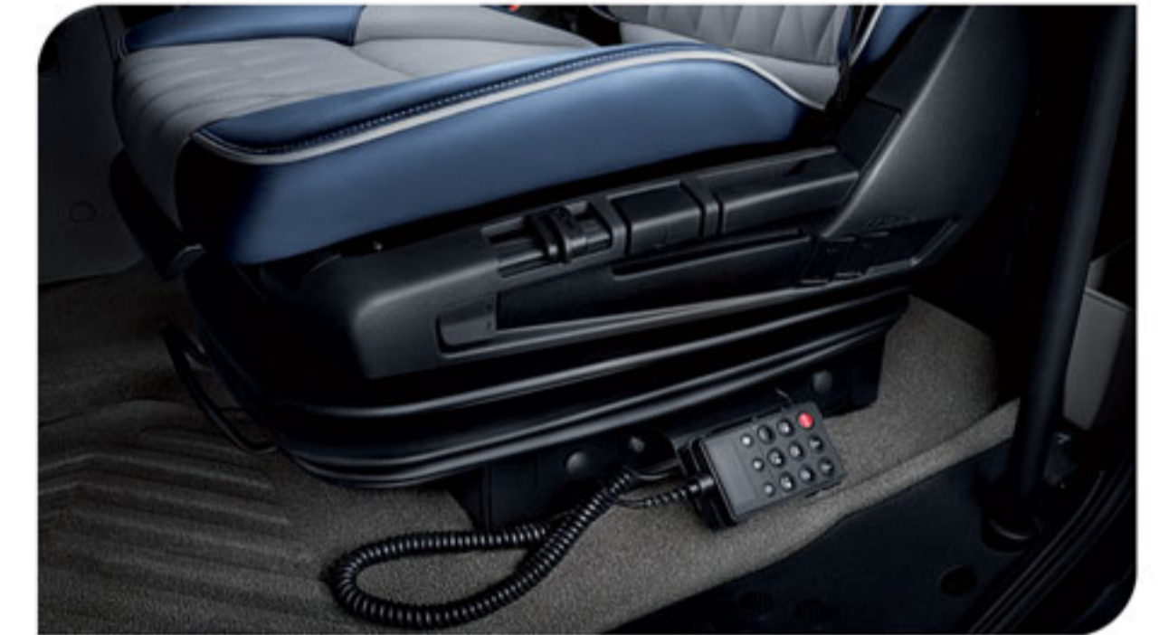
- صندلی راننده با سیستم تعلیق بادی و قابلیت تنظیم در ۶ جهت