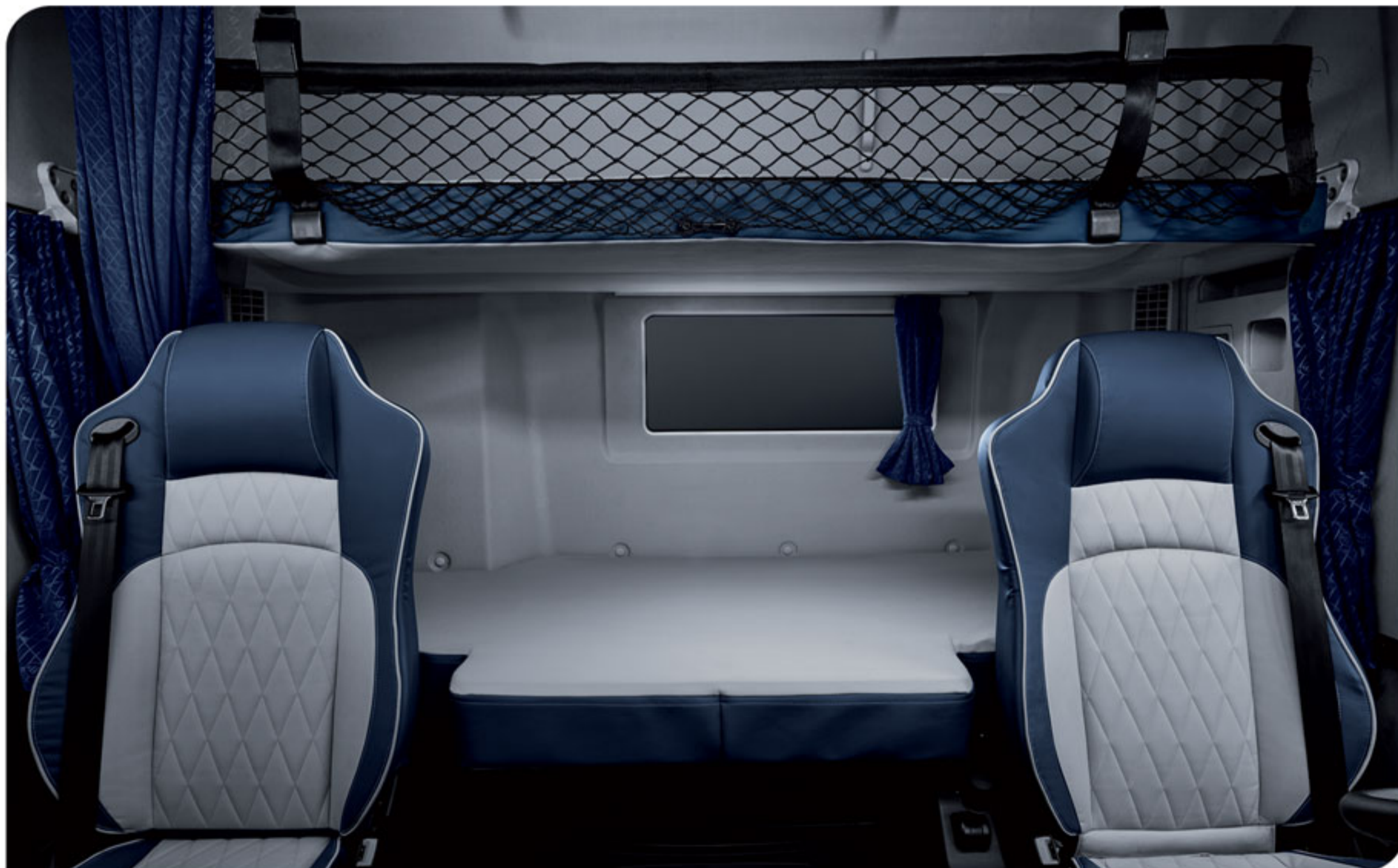
- دارای دو تخت خواب بزرگ جهت استراحت راننده و سرنشین