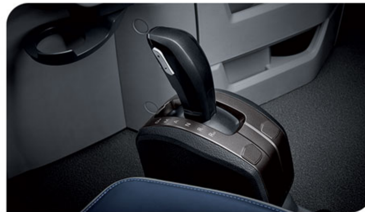
- دسته دنده مدرن (تعویض دنده اتوماتیک و دستی)