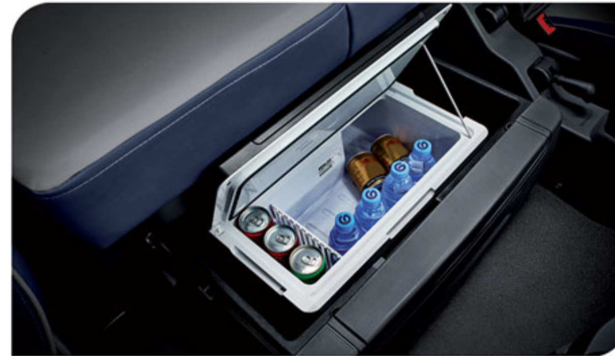
- مجهز به یخچال مسافرتی در زیر تخت