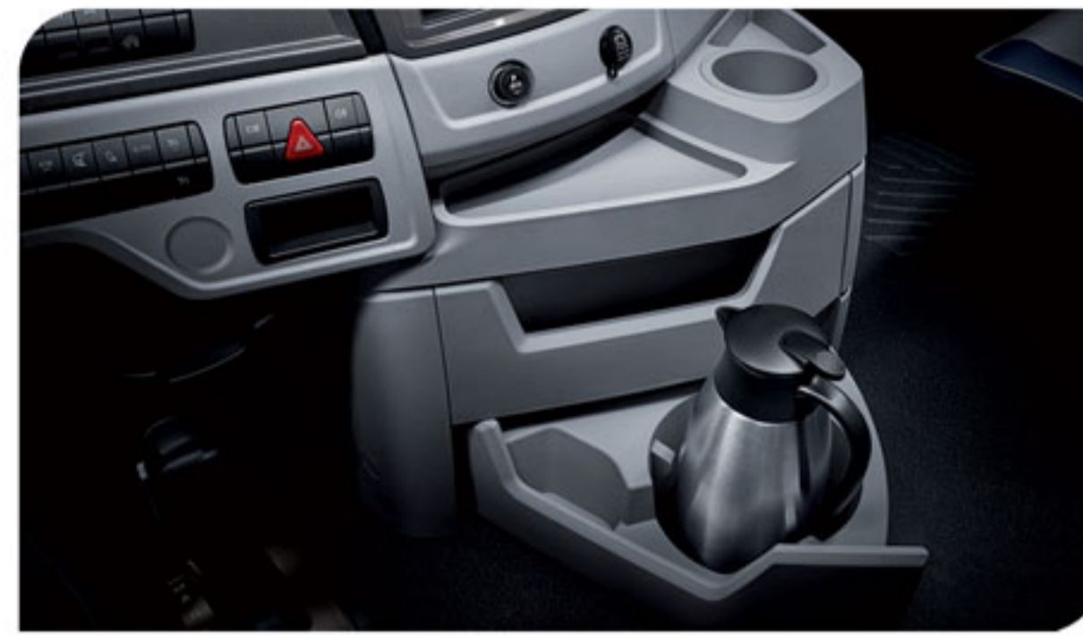
- محفظه‌های متعدد جهت نگهداری وسایل