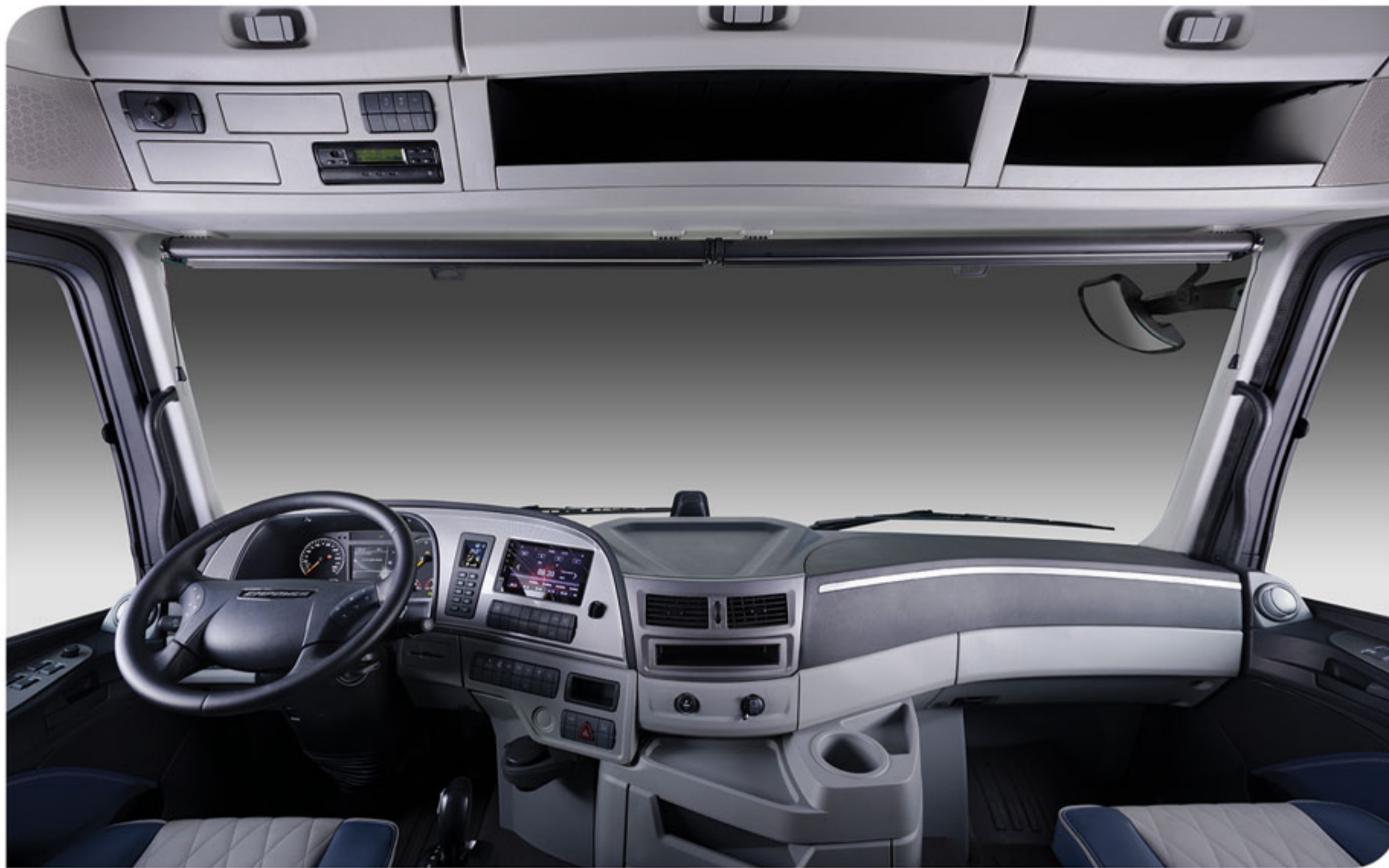
- کابین ارگونومیک و مدرن