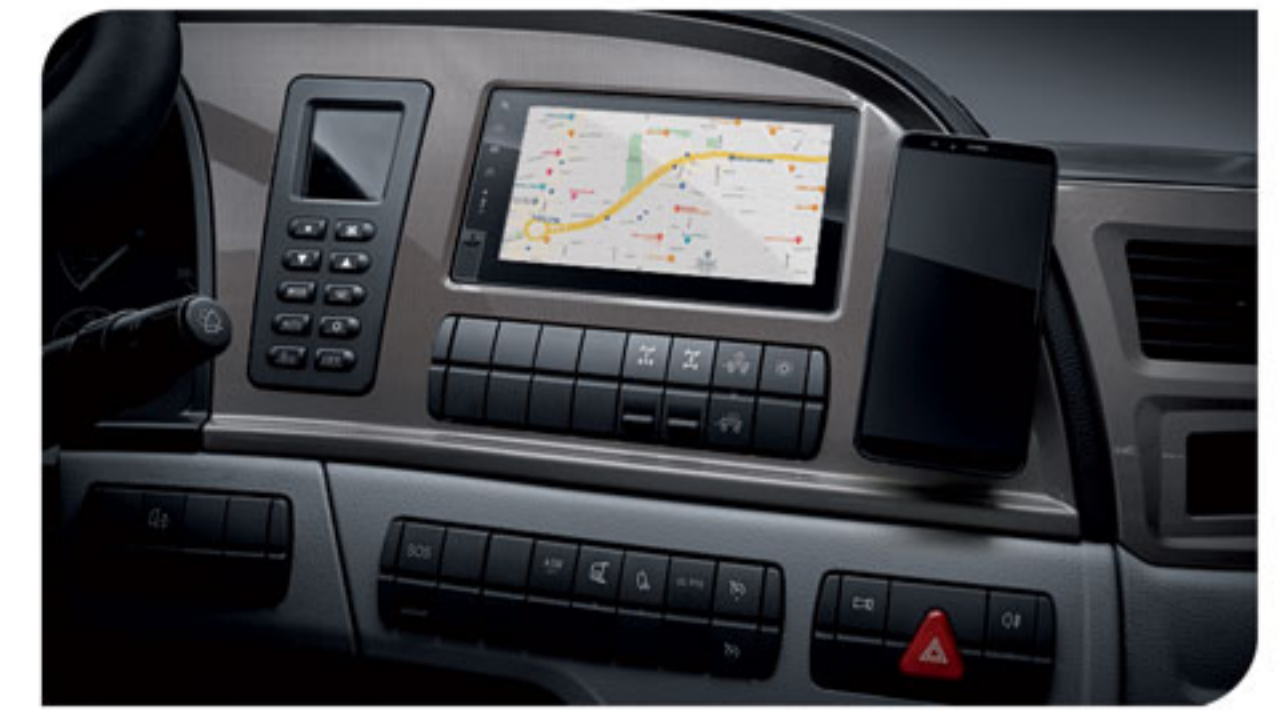
- مولتی مدیا TFT لمسی (رادیو، رهیاب، بلوتوث، USB، SD)