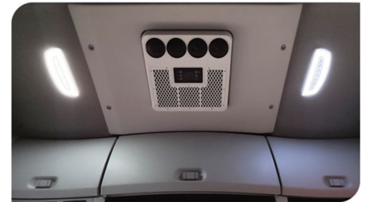
- کولر درجا