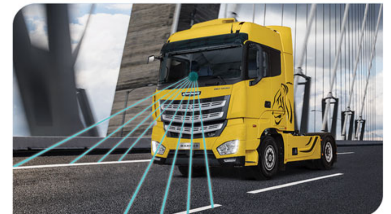
- سیستم هشدار حرکت بین خطوط LDWS