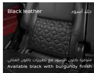
جلد أسود Black leather

متوفرة باللون الأسود مع تطريزات باللون العنابي Available black with burgundy finish