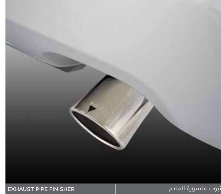
EXHAUST PIPE FINISHER

*أكسسوارات محلية، للشروط والأحكام الخاصة بالضمان، يرجى مراجعة الوكلاء المعتمدين.