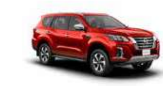
أحمر S (AX6) RED S (AX6)