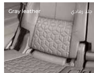
جلد رمادي Gray leather