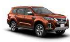
بني PM (CAU) BROWN PM (CAU)