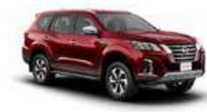
احمر داكن PM (NAW) RED PM (NAW)