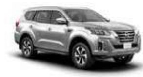
فضي M (K23) SILVER M (K23)