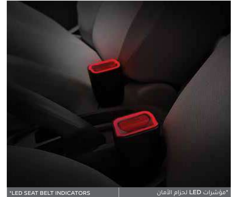
*LED SEAT BELT INDICATORS