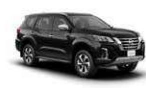
أسود (G42) BLACK (G42)