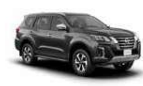
رمادي FPM (K21) GRAY FPM (K21)