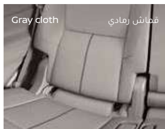
قماش رمادي Gray cloth