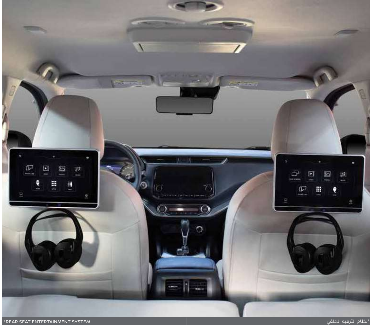
*REAR SEAT ENTERTAINMENT SYSTEM