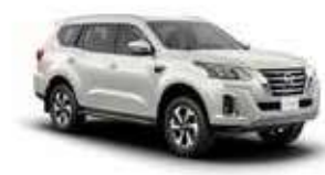
أبيض 3P (QX1) WHITE 3P (QX1)

وتحرص نيسان على التأكد من أن عينات الألوان المعروضة هنا تعكس الألوان الفعلية للسيارة بأقرب درجة ممكنة. وقد يعزى الاختلاف الطفيف في عينات الألوان إلى عملية الطباعة، أو طريقة العرض سواء كانت في ضوء النهار أو الإضاءة الفلورية أو المتوهجة، لذا ننصحك برؤية الألوان الفعلية لدى وكيل البيع.