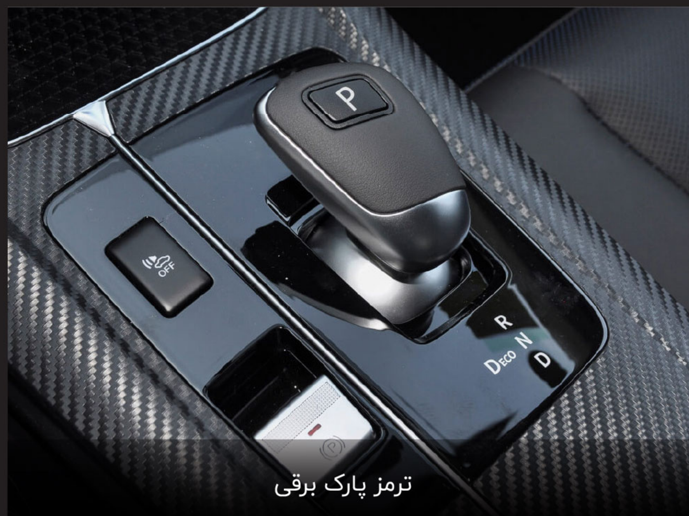
ترمز پارک برقی