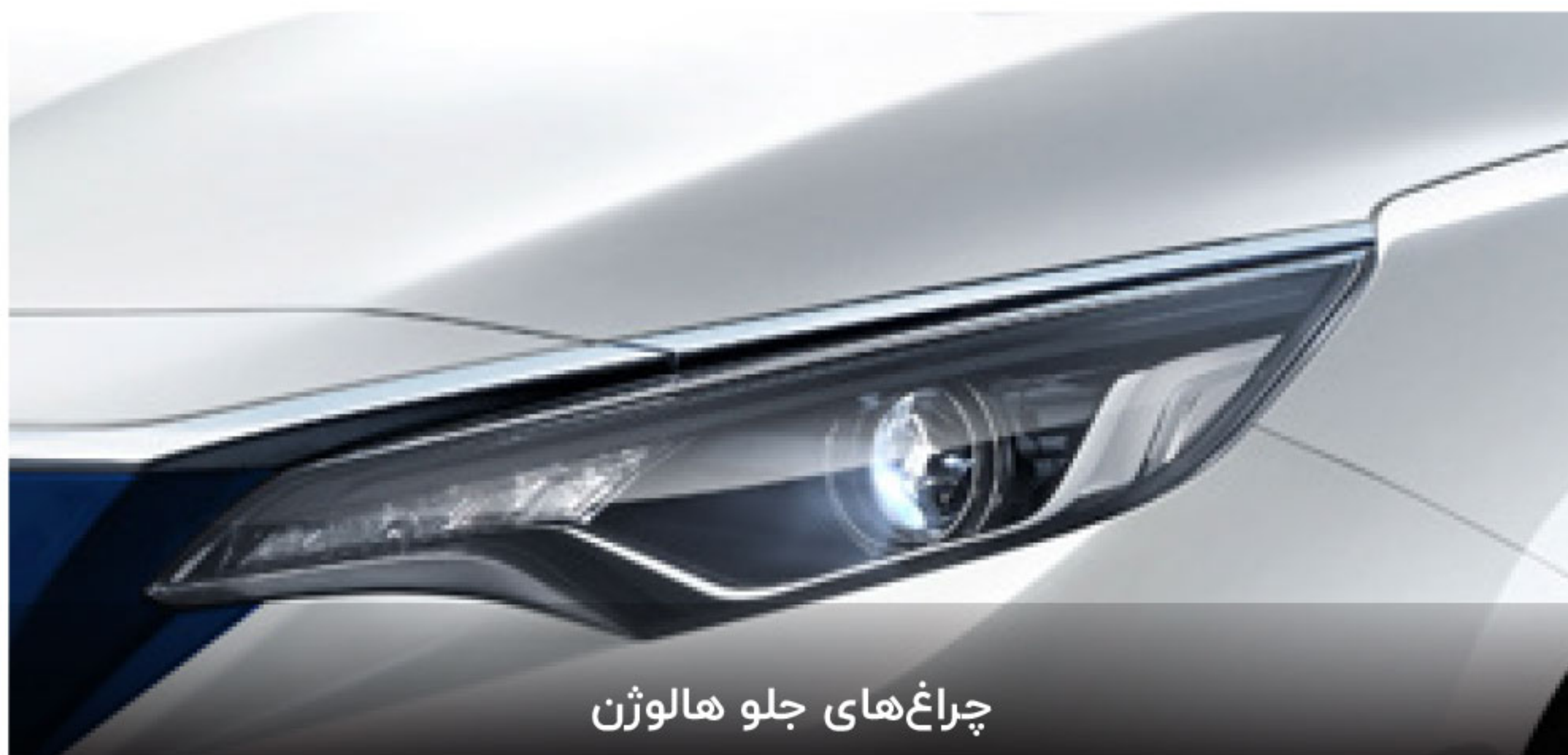
چراغ‌های جلو هالوژن