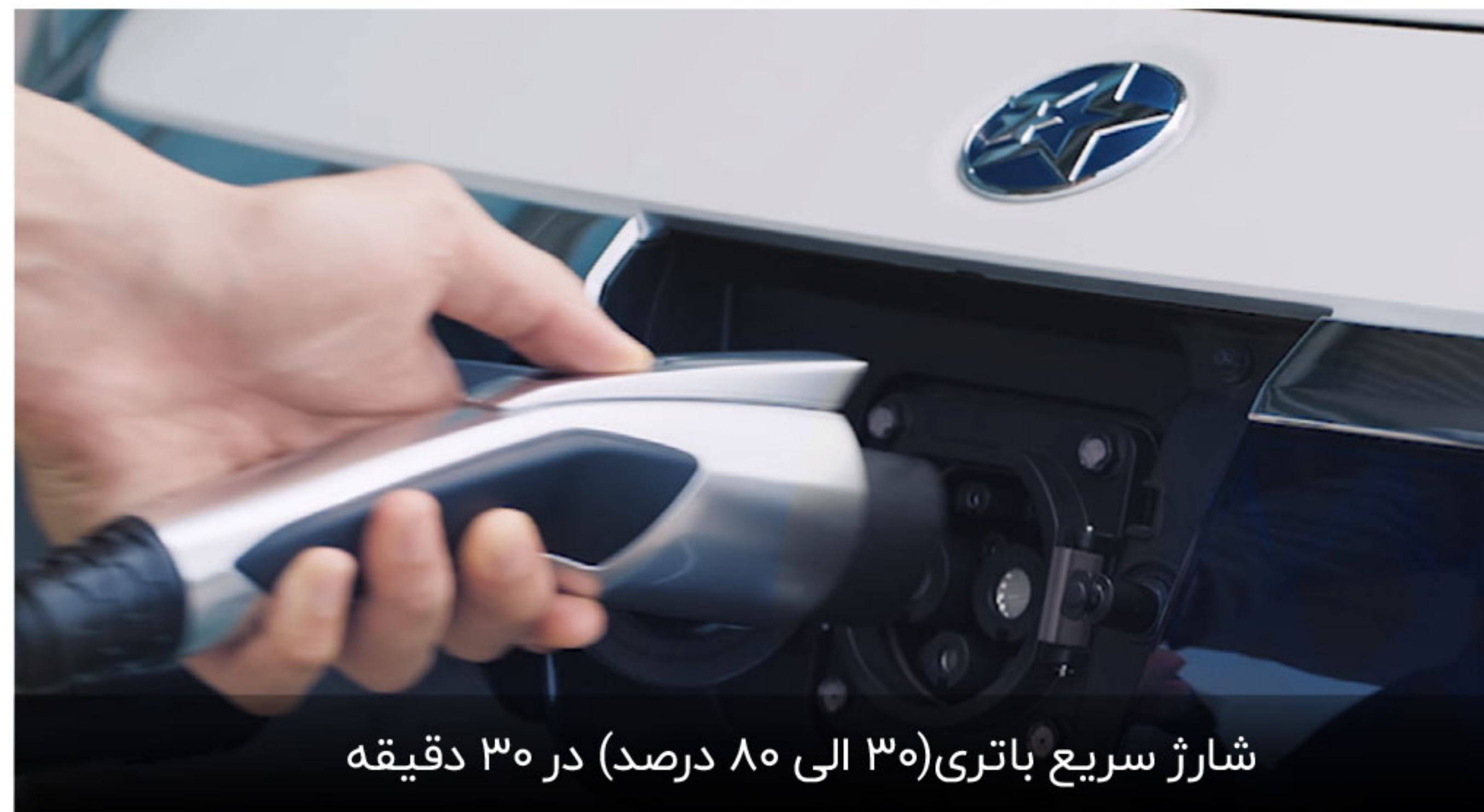
شارژ سریع باتری (۳۰ الی ۸۰ درصد) در ۳۰ دقیقه