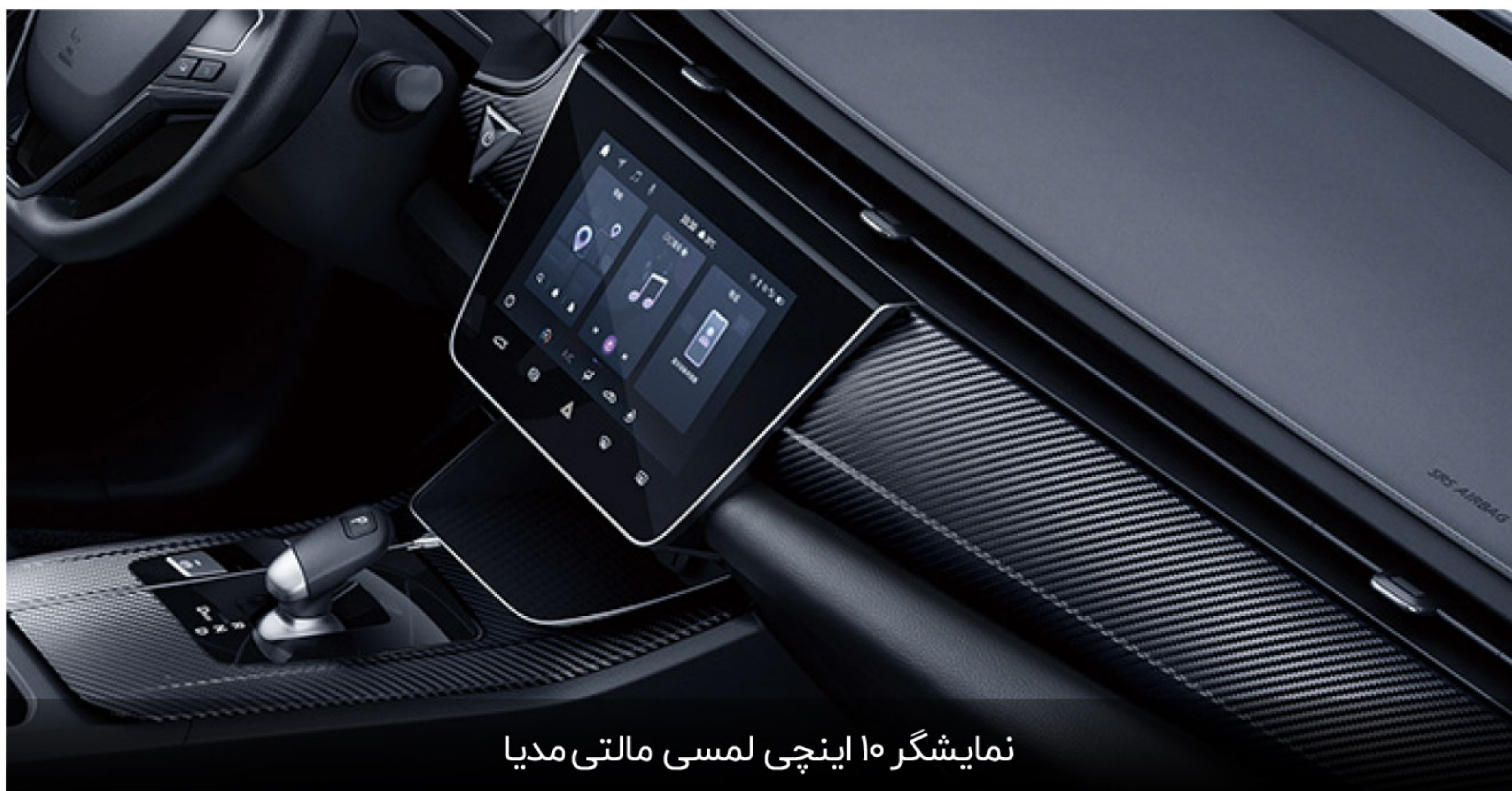
نمایشگر ۱۰ اینچی لمسی مالتی مدیا