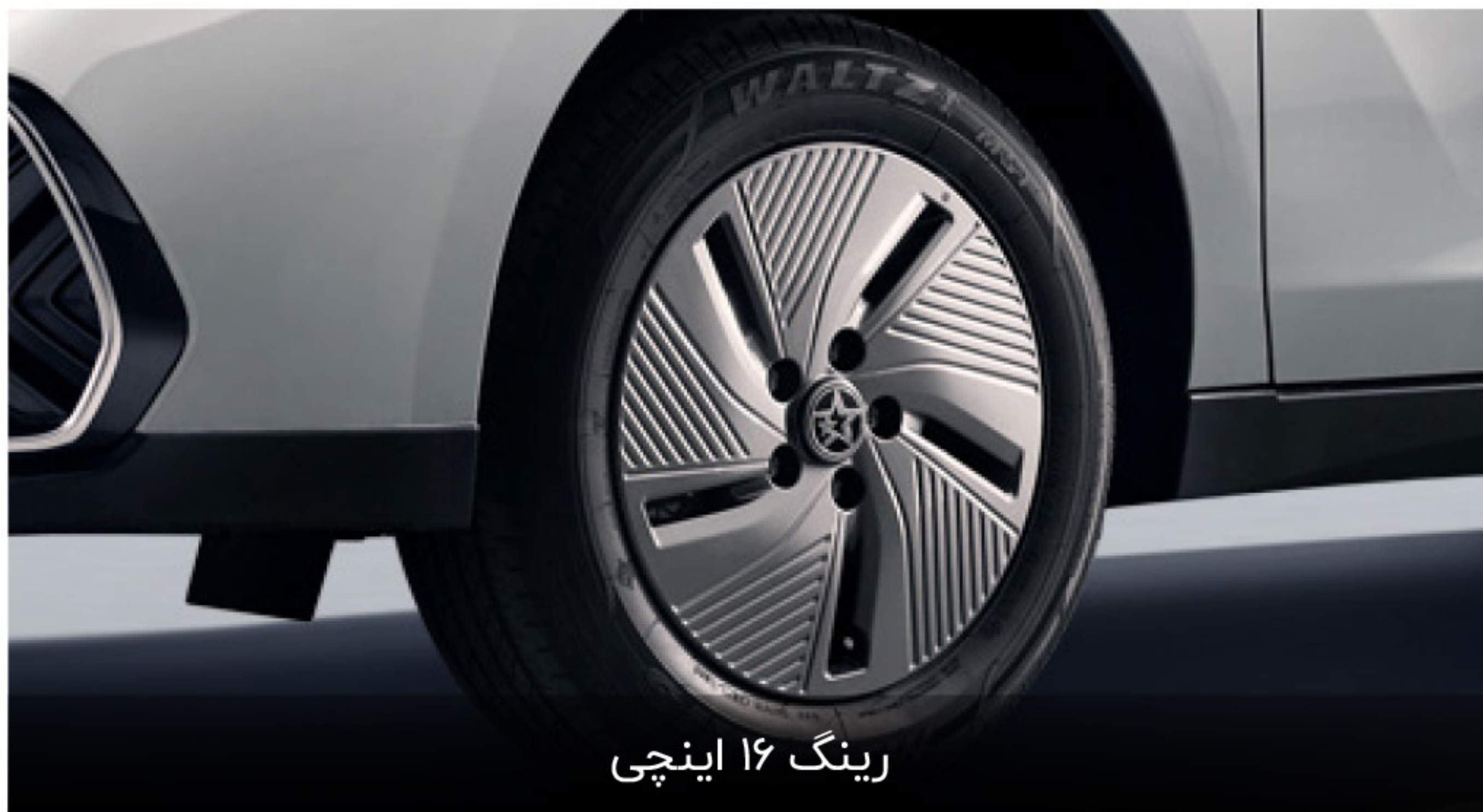
رینگ ۱۶ اینچی