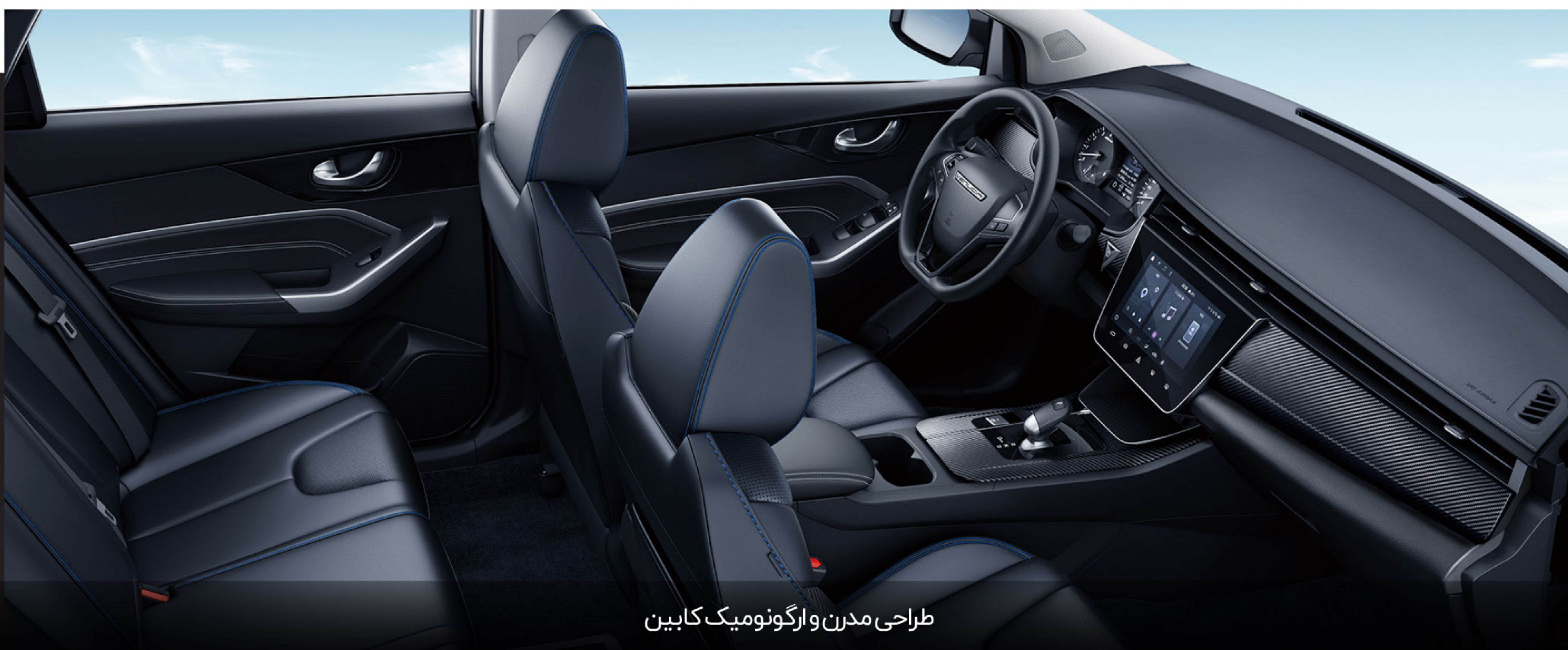
طراحی مدرن و ارگونومیک کابین