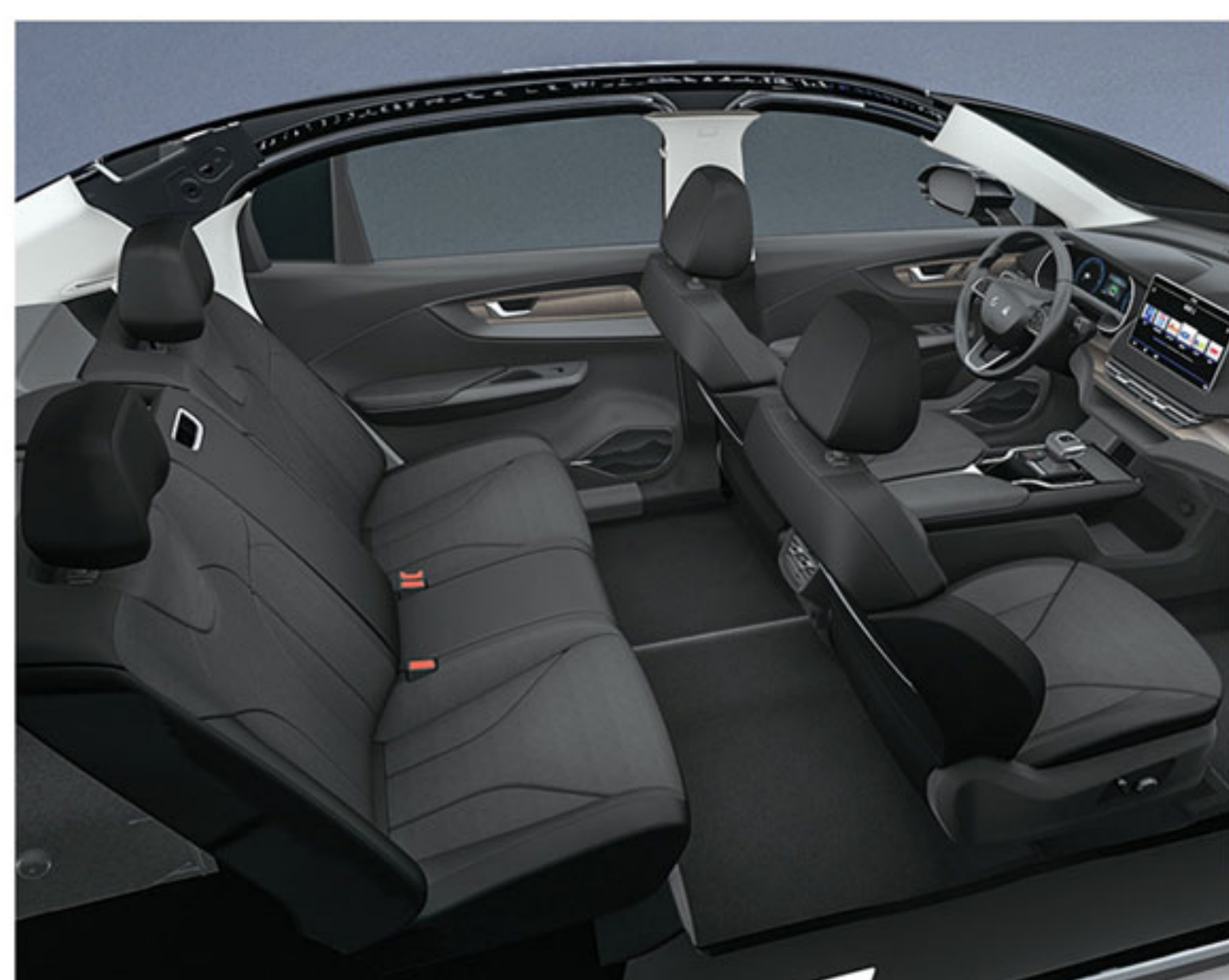
..... کابین مدرن و بزرگ