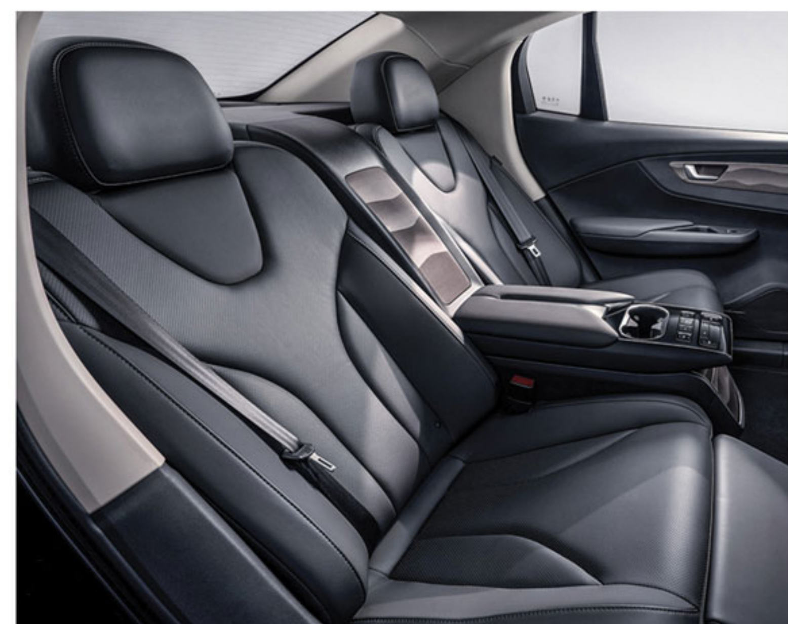
..... رنگ تریم داخلی مشکی