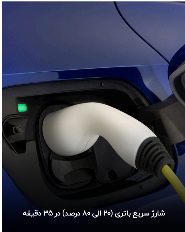
شارژ سریع باتری (۲۰ الی ۸۰ درصد) در ۳۵ دقیقه