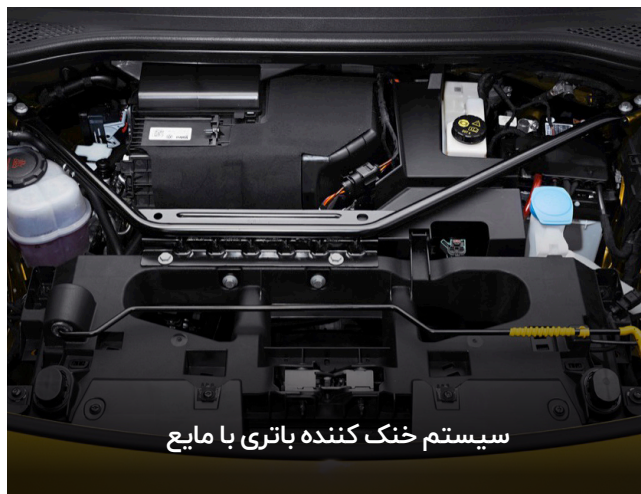
سیستم خنک کننده باتری با مایع