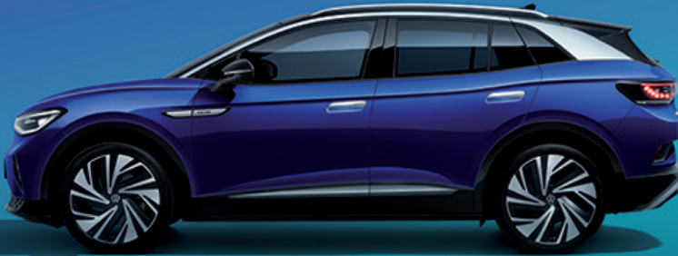
پلتفرم MEB فولکس واگن